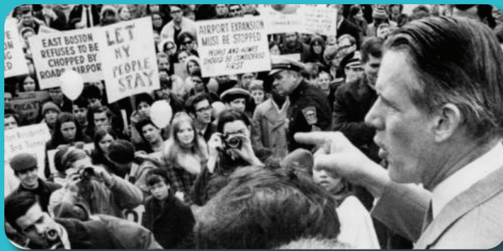
Vào ngày 30 tháng 11, 1970, không lâu sau khi trở thành Thống Đốc Massachusetts, Francis Sargent đã công bố tạm ngừng xây dựng xa lộ bên trong đường vòng Route 128 và kêu gọi một nghiên cứu toàn diện, nhiều phương thức về các nhu cầu giao thông của khu vực.

Thông qua Đạo Luật về Xa Lộ Do Liên Bang Trợ Cấp (Federal-Aid Highway Act) năm 1973, Các Tổ Chức Quy Hoạch Đô Thị được trao quyền cho phép sử dụng quỹ giao thông liên bang.