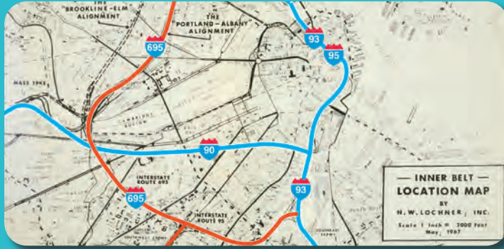
Các dự án, như Inner Belt ở Massachusetts, đã làm cho hàng ngàn người phải di dời.