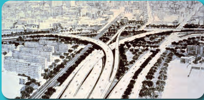
Các MPO là chủ yếu là sự phản ứng đối với thời đại xây dựng xa lộ thập niên 1950.