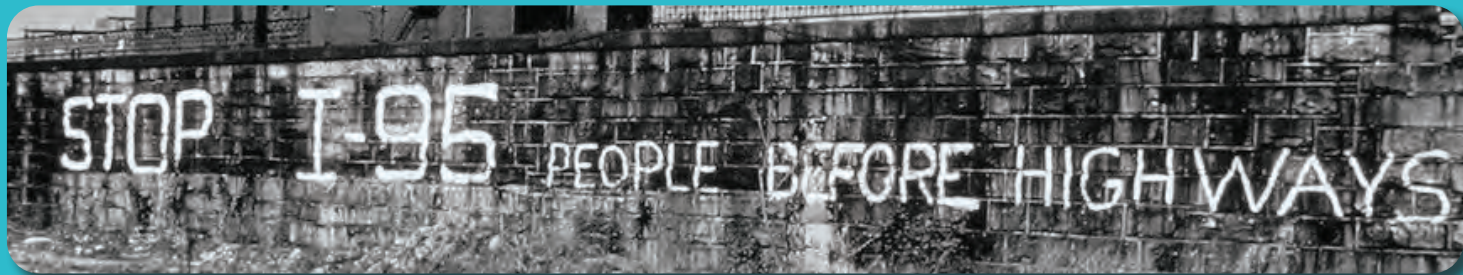
Từ 1950-70, phong trào “Highway Revolts” (phản đối xa lộ) đã thách thức quy hoạch xa lộ truyền thống.