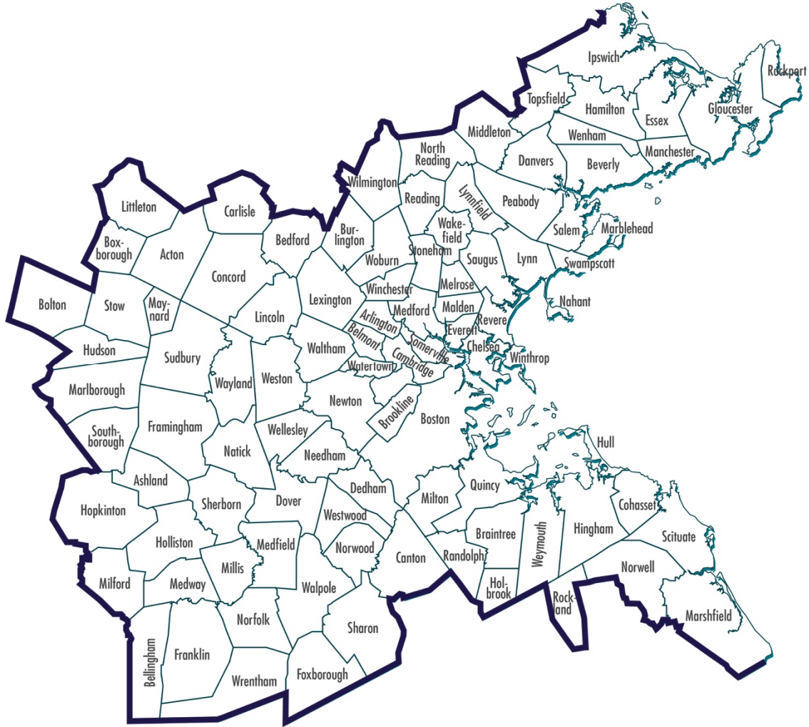
波士頓地區的城市

MPO 委員會由 22 名有投票權的成員組成。當中幾個州立機構、地區組織和波士頓市是永久投票成員；另外會選出 12 個城市作為投票成員，期限為 3 年。8 個城市成員代表波士頓地區的 8 個分區，另外還有 4 個全區市政席位。聯邦高速公路管理局 (FHWA) 和聯邦捷運局 (FTA) 在 MPO 委員會擔任顧問（無投票權）成員。附錄 F 會有關於 MPO 永久成員的詳細資料。